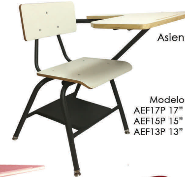
Asiento, Espaldar, Tope "Plywood"