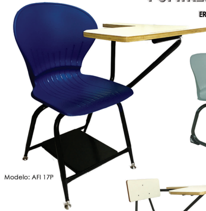
Modelo: AFI 17P

ERGONÓMICOS Y CON LAS ESPECIFICACIONES DEL Departamento de Educación