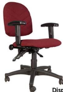
Modelo: CE-95 Ergonómica Con Brazos / Sin cabezal Asiento Pequeño Medida: 17" d x 19" w Espaldar Pequeño Medidas 17" w x 18" h

Disponibles Sin Brazos / Sin Cabezal Modelo: CE-94 Ergonómica