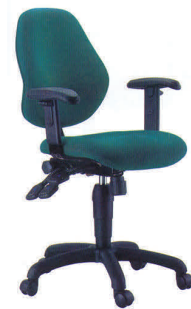
Modelo CE- 1995 Silla Ergonómica Espaldar y Asiento Promedio Con brazos / Sin Cabezal

Disponibles Con Cabezal / Sin Brazos Modelo: CE-995 Ergonómica