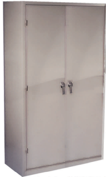
Modelo: JII183672-5 Armario Hercules Extra Fuerte

ARMARIO * ARCHIVOS * ARMARIOS & ARCHIVOS COMBINADOS