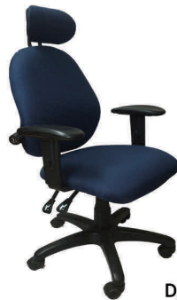
Modelo: CE-994 Ergonómica Con Cabezal / Con Brazos Asiento Pequeño Medida: 17" d x 19" w Espaldar Pequeño Medidas 17" w x 21" h

Disponibles Con Cabezal / Sin Brazos Modelo: CE-995 Ergonómica