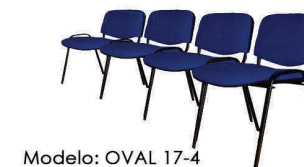
Modelo: OVAL 17-4