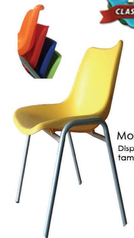
Modelo: KE 18 Disponible tamaño 15"