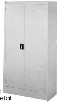
Modelo: DX72 Armario de Metal con puertas y llave.

NO tornillos NO remaches NO ensamble manual