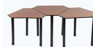
Modelo K333L Madera laminada. Estructura de metal.

Patatas fijas o ajustables. Opciones de portatlibros y teclado.