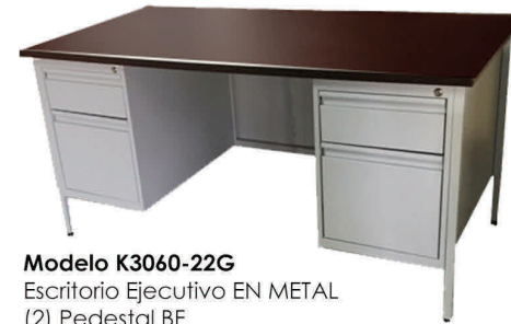
Modelo K3060-22G Escritorio Ejecutivo EN METAL (2) Pedestal BF Medidas: 60a"x30p"x29"-30"a