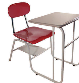
Modelo: Hércules K831TH