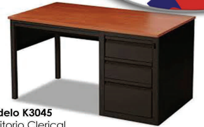
Modelo K3045 Escritorio Clerical (1) Pedestal BBF Medidas: 45"a x30" p x 30"a