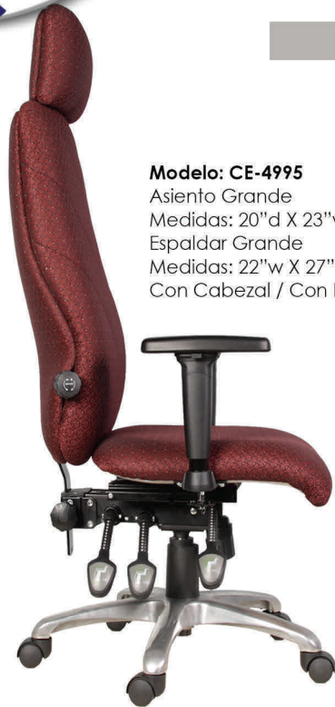
Modelo: CE-4995 Asiento Grande Medidas: 20" d X 23" w Espaldar Grande Medidas: 22" w X 27" h Con Cabezal / Con Brazos

EVITE DOLORS MUSCULARES Y TRASTORNOS FISICOS, COMPRANDO MOBILIARIOS DE Calidad