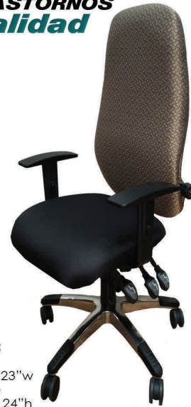
Modelo: CE-3995 Asiento Grande Medidas: 20" d X 23" w Espaldar Grande Medidas: 22" w X 24" h Sin Cabezal / Con Brazos