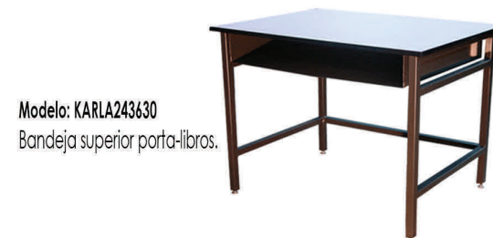
Modelo: KARLA243630 Bandeja superior porta-libros.

Disponibles en una variedad de medidas y colores.