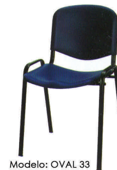
Modelo: OVAL 33