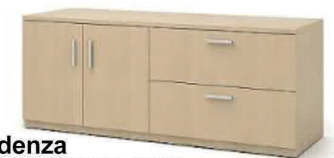
Credenza Modelo KWPBL7220 Medidas: 72"ax20"px29"-30"a CREDENZA CON 2 GVT. TIPO ARCHIVO LATERAL, 2 PUERTAS Y 1 TABULLA INTERIOR