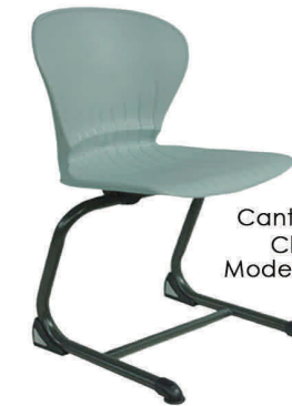
Cantilever Style Chair 18" Modelo: AFIK18