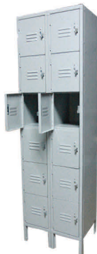
Lockers Modelo: EL7824-12 Medidas: 76" Al x 24" A Medidas del Encasillado: 11" A x 16.5" P x 10.5 Al 12 Encasillados

BIBLIOTECAS DE METAL Y MADERA LAMINADA EXTRA FUERTE