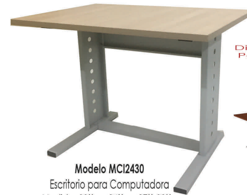
Modelo MCI2430 Escritorio para Computadora Medida: 30" a x 24" p x 27"-30" a

Disponibles con Porta teclado (Keyboard)