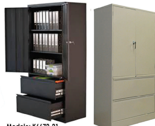
Modelo: K6672-21 Archivo Lateral con doble gabinete