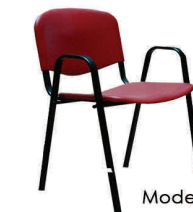
Modelo: OVAL 32