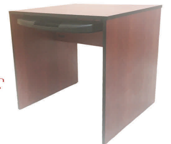
Modelo CFMC2430 KB Escritorio para Computadora en Madera Laminada. Medida: 30" a x 24" p x 27"-30" a