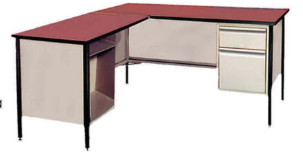
Modelo: KS53622-P Escritorio Secretarial (1) pedestal BF Retorno con Papelera Medidas: 66"x30"x29"-30"a Retorno: 40"x24"x26"-27"a