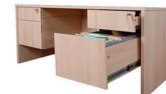
Modelo KWPBL6030 Escritorio Ejecutivo Medida: 60a"x30p"x29"-30"a