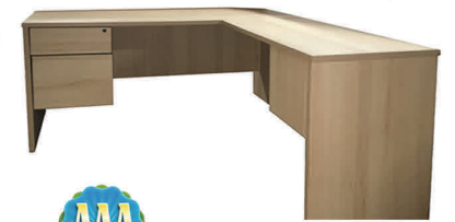
Modelo KWPBL6630 Escritorio Ejecutivo con Retorno Medidas: 66a"x30p"x29"30"a Retorno: 42a"x24p"x29"-30"a DISPONIBLE SECRETARIAL Modelo KWPBL6630-4224-26