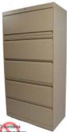
NO tornillos NO remaches NO ensamble manual SERIE JIII2036 - Clasificación AAA SERIE 1836-F - Clasificación AA SERIE 1836-FE - Clasificación A