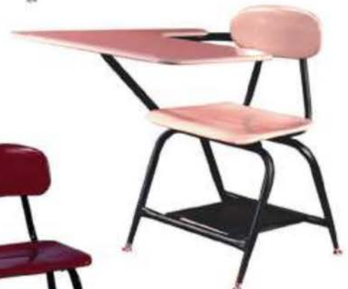
Modelo: AEF THP

GARANTÍA GARANTIZADA CON SEGURIDAD EN P.R.