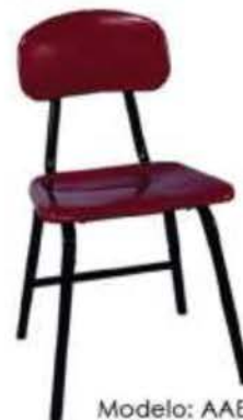
Modelo: AAEF THS

Asiento, espaldar, tope en Thermoset . Altura de asiento de 13", 15" Y 17"