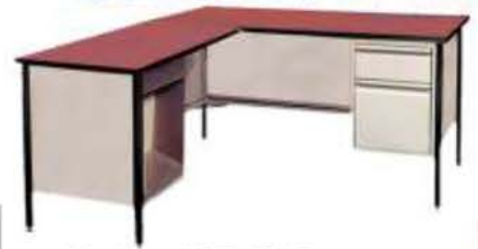
Modelo: KS53622-P Escritorio Secretarial (1) pedestal BF Retorno con Papelera Medidas: 66"x30"x29"-30"a Retorno: 40"x24"x26"-27"a