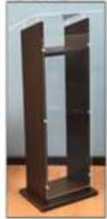
Modelo: PMLA243048 Clasificación AA - Madera Laminada & Acrilico Medidas: 24" prof. x 30" a x 48" al