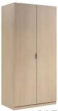
Modelo: CF183672-5 Armario de madera laminada con cerradura y llave