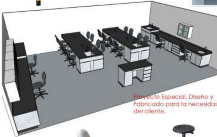
Proyecto Especial. Diseño y Fabricado para la necesidad del cliente.