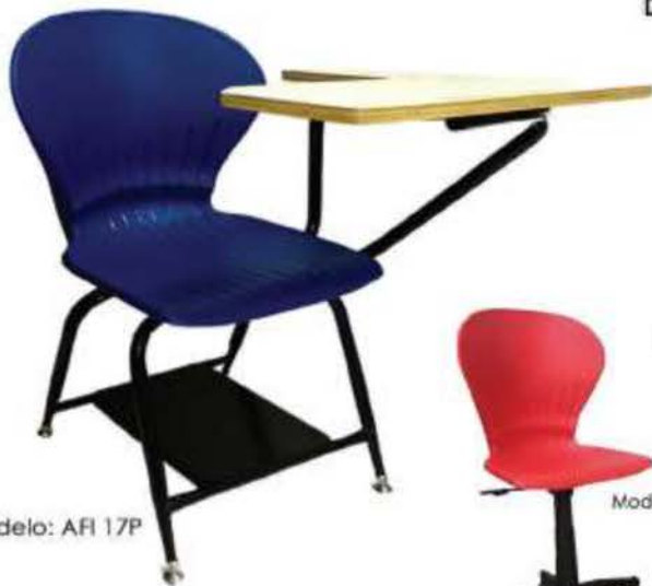
Modelo: AFI 17P

ERGONÓMICOS Y CON LAS ESPECIFICACIONES DEL Departamento de Educación