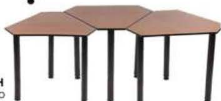
Modelo: AFI303410 Tope en Madera Laminada

Patatas fijas o ajustables. Opciones de portatrabajo y teclado.