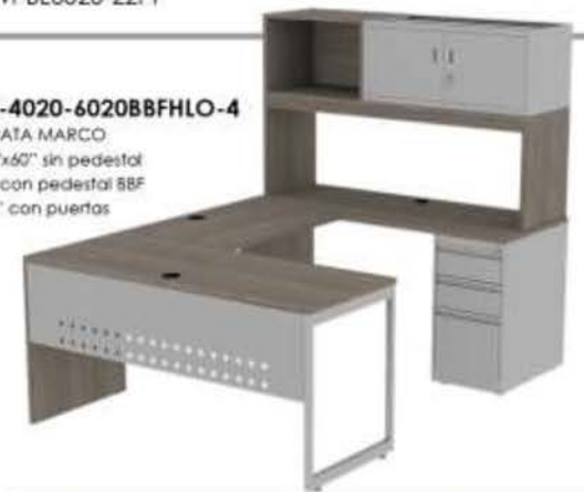
Sistema 4LO Modelo: CF3060-4020-6020BBFHLO-4 (1) Escritorio 30"x60" /PATA MARCO (1) Retorno-puente 20"x60" sin pedestal (1) Credenza 60"x20" con pedestal BBF (1) Hutch" 14"x59"x42" con puertas y compartimento