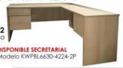
Modelo KWPBL6030-4220-22 Escritorio Ejecutivo con Retorno Medidas: 66a"x30p"x29"-30"a Retorno: 42a"x24p"x29"-30"a DISPONIBLE SECRETARIAL Modelo KWPBL6630-4224-2P