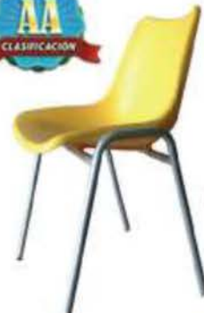
KE 18 Disponible tamaño 15"