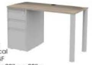
Modelo K3045 Escritorio Clerical (1) Pedestal BBF Medidas: 45" a x30" p x 30" a