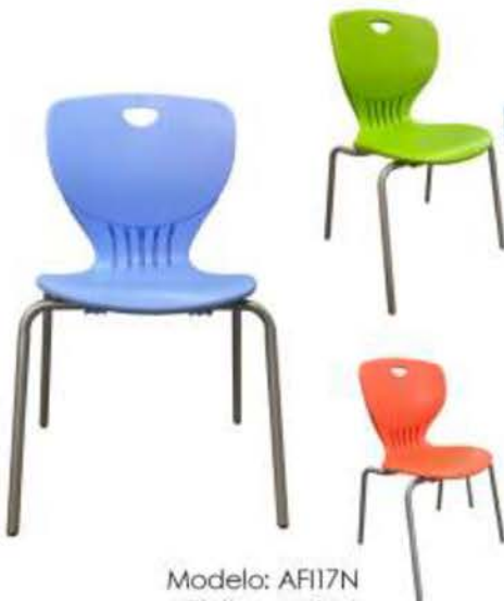
Modelo: AFI17N 15"alto - AFI15N 13"alto - AFI13N