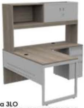
Sistema 3LO Modelo: CF3060-3620BBFHLO-3 (1) Escritorio 24"x60" pata MARCO (1) Retorno-Puente 36"x20" con pedestal BBF (1) Hutch" 14"x59"x42" con puertas metal y compartimento