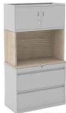
Modelo: AA1836-DCF183672 Armario y Archivo lateral en metal con cerradura y llave independiente, conformado con estructura en madera laminada.