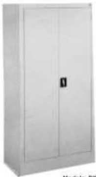
Modelo: DX72 Armario de Metal con puertas y llave.