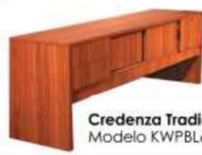
Credenza Tradicional Modelo KWPBL6020-22PP

MOBILIARIOS CALIDAD SUPERIOR Modelo: Sistema 6 (1) Peninsula 30"x60" (1) Retorno-puente 20"x40" sin pedestal (1) Credenza 60"x20" (1) Pedestal BBF, (1) Biblioteca "hutch" 14"x59"x42" con puertas. (1) Armario & Archivo lateral