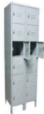
Locker de 2 y 6 encasillados