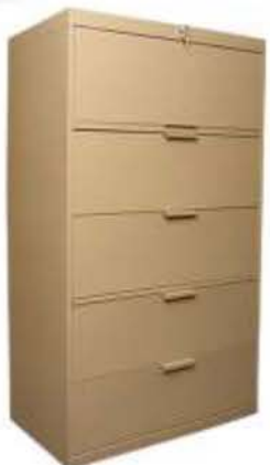
Modelo: 1836-F5 [5 Gavetas 36" A x 18" F x 62" A] Serie 1836-AA Disponible en 2, 3, 4 y 5 gavetas.

ARMARIO * ARCHIVOS * ARMARIOS & ARCHIVOS COMBINADOS