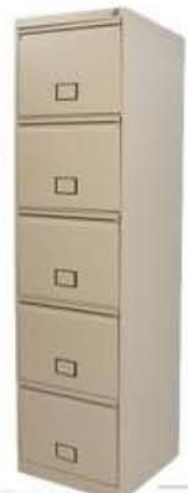
Serie JIII Clasificación AAA