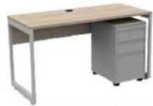
Modelo: CF2448LO-MBBF (1) Escritorio 24"x48" pata MARCO (1) Pedestal Móvil BBF