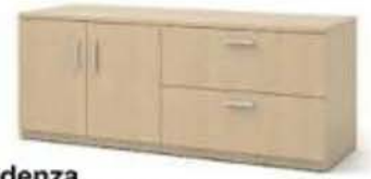
Credenza Modelo KWPBL7220 Medidas: 72"ax20"px29"-30"a CREDENZA CON 2 GVT. TIPO ARCHIVO LATERAL, 2 PUERTAS Y 1 TABLILLA INTERIOR