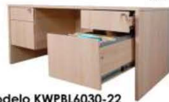
Modelo KWPBL6030-22 Escritorio Ejecutivo Medida: 60a"x30p"x29"-30"a