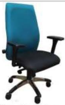
Sillas Ejecutivas y Secretariales diversidad de Estilos y Colores