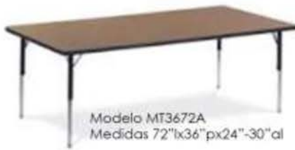
Modelo MT3672A Medidas 72"lx36"px24"-30"al