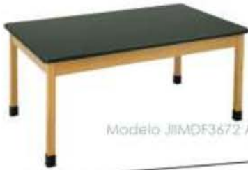
Modelo JIIMDF3672 AA

Variedad de Mesas de Laboratorio, fabricado en Metal o Madera con tope en Fenólico.