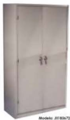
Modelo: JIII8672-5 Armario Hechates Extra Fuerte