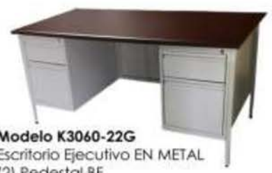
Modelo K3060-22G Escritorio Ejecutivo EN METAL (2) Pedestal BF Medidas: 60a"x30p"x29"-30"a